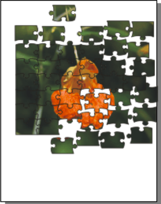
Jigsaw Puzzle Creator shareware US$39.95